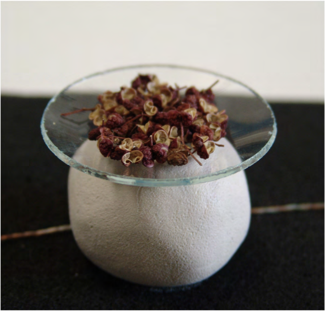
Détail, poivre de Sichuan