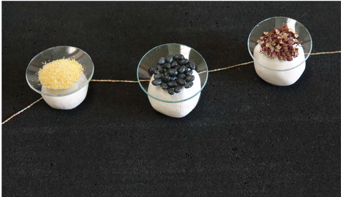
Tapis en mousse, fil, cailloux de porcelaine, verres de montre et ingrédients