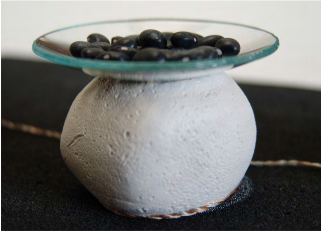
Détail, haricots noirs, semoule de maïs